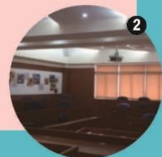
▲圖1 研究生研究室 ▶圖2 企管系研究所專業教室